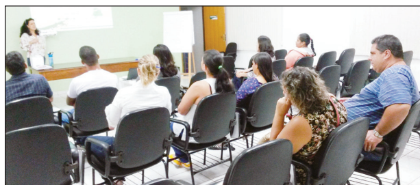
Aula do PAS no auditório ACEIG

O SEBRAE-SP em parceria com a ACEI-Igarapava vem realizando o PAS importante Programa de capacitação para as empresas do setor de alimentação para a cidade de Igarapava.