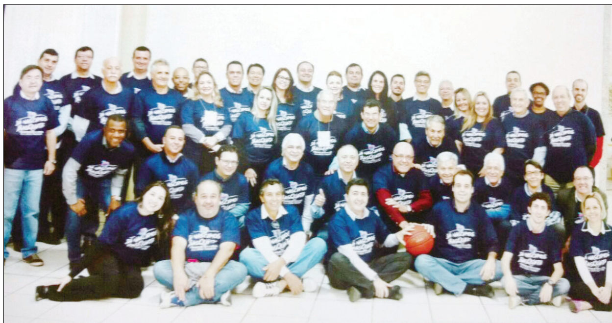
Participantes do Seminário regional em Franca

Os seminários e encontros que reúnem as AC’S são sempre muito bem-vindos e importantes, pois nos ajudam a descobrir as necessidades da classe empresarial e encontrar soluções nas ideias compartilhadas, além de podermos aprimorar conhecimentos do nosso cotidiano.